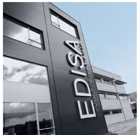
Centro I+D+i Ourense

La experiencia acumulada en los más de 500 proyectos realizados, nos permite acortar los tiempos de puesta en marcha de nuestras soluciones, con garantía sobre los resultados a alcanzar, así como la mejora continua de la funcionalidad y calidad de los productos y servicios que ofrecemos.