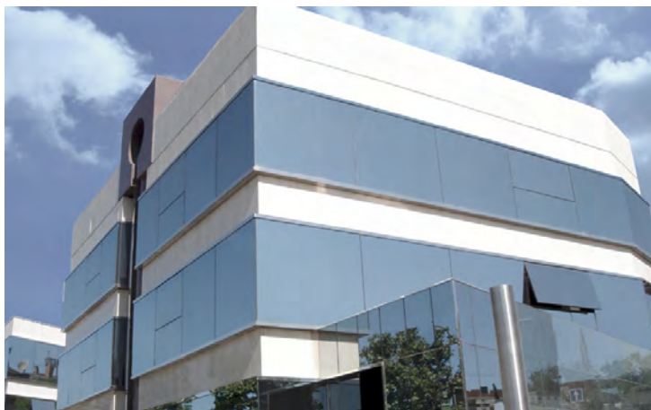
Sede central Madrid